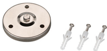
Рисунок 1. Основание для установки на поверхность (арт. 024890).