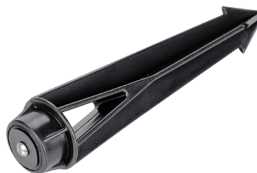
Рисунок 2. Основание для установки в грунт (арт. 024888).